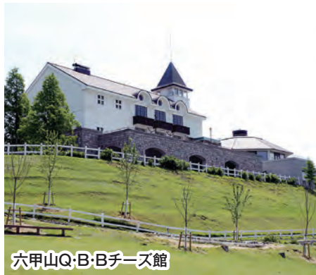
穴甲山Q・B・Bチーズ館